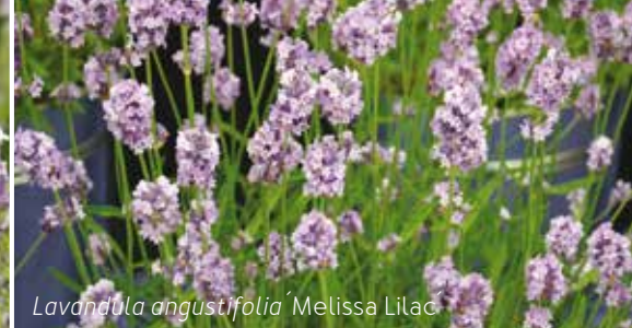
Lavandula angustifolia 'Melissa Lilac'