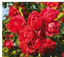
Pauls Scarlet Climber