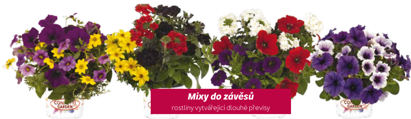
Mixy do závěsů