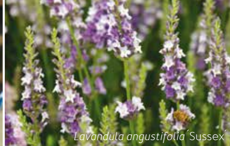
Lavandula angustifolia 'Sussex'