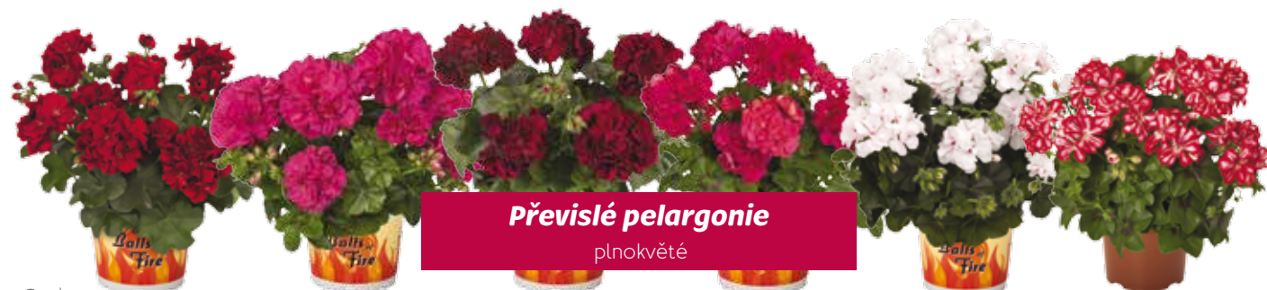
Převislé pelargonie plnokvěté