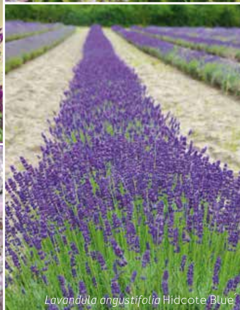
Lavandula angustifolia 'Hidcote Blue'