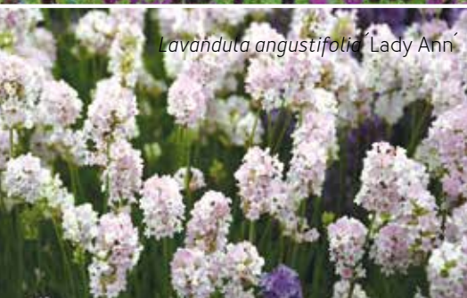
Lavandula angustifolia 'Lady Ann'