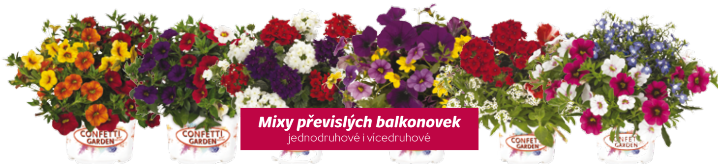
Mixy převislých balkonovek jednodruhovité i vícedruhovité