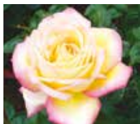
Gloria Dei / Peace