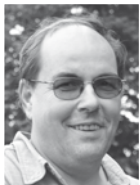
TEXT A FOTO Pavel Chlouba

Levandule patří k nejoblíbenějším rostlinám, které pěstujeme na našich zahradách kvůli silné a velmi charakteristické vůni. Je velmi pravděpodobné, že patří dokonce k nejdéle používaným aromatickým bylinám, které lidstvo vůbec znalo.