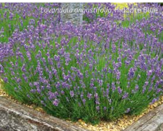
Lavandula angustifolia 'Hidcote Blue'

virů a bakterií, ale levandule už se cíleně používala k tomu, aby chránila lidi před nebezpečnými nemocemi. Možná k tomu v mnoha ohledech pomohla náhoda, ale nesnižuje to význam této jedinečné rostliny. Lidé, kteří pracovali v dílnách na výrobu rukavic, používali