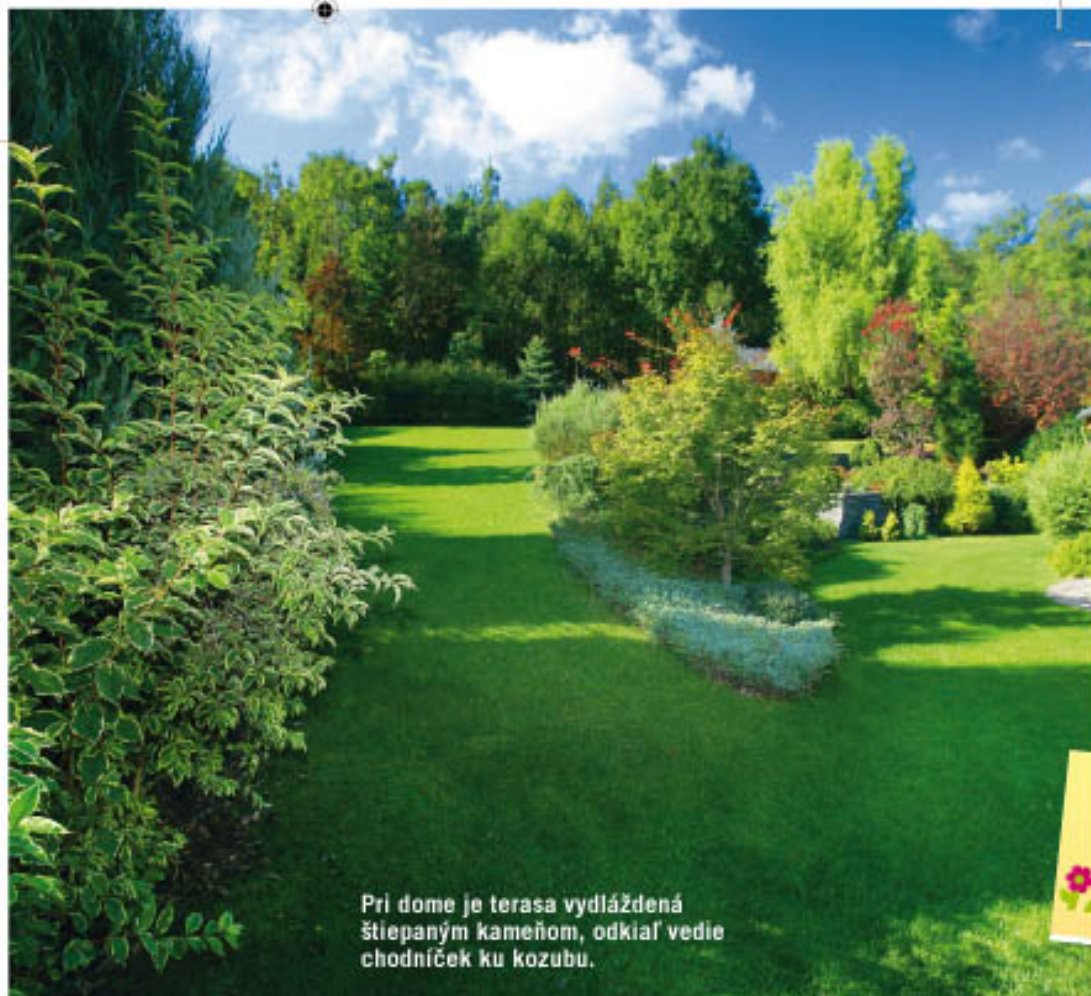
Pri dome je terasa vydláždená štiepaným kameňom, odkiaľ vedie chodníček ku kozubu.

Pri plánovaní sme mali na pamäti, aby každý pohľad z okna domu von bol zaujímavý a priniesol estetiku v každom ročnom období.